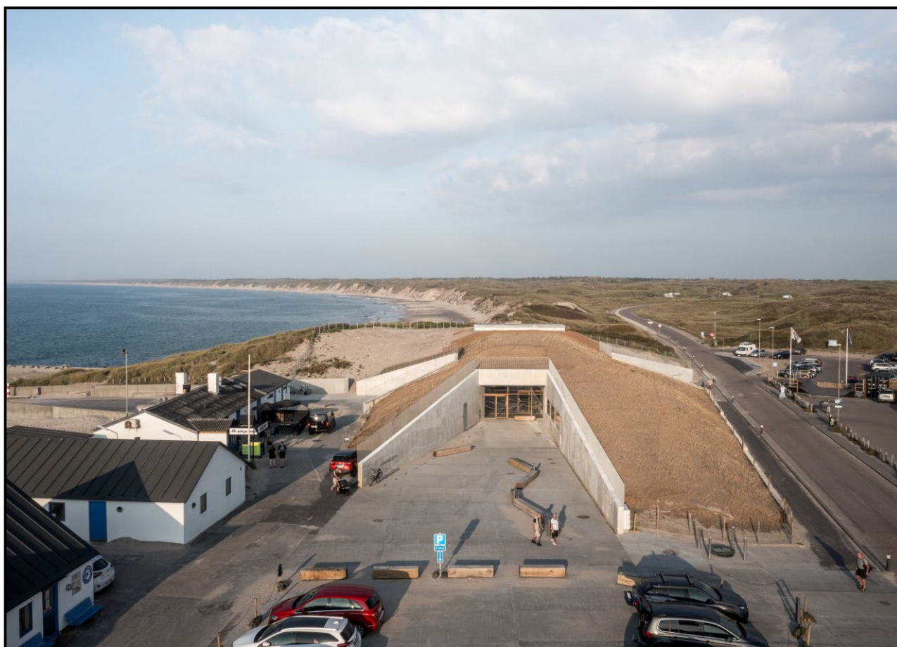
Med en dør ind til byen og en dør ud til naturen.

En varm tak skal rettes til alle de, der har bidraget såvel fagligt som økonomisk til tilblivelsen af Nationalparkcenter Thy, herunder også de mange frivillige, der er med til hver eneste dag at sikre, at gæsterne møder et hjælpsomt menneske, når de kommer på besøg.