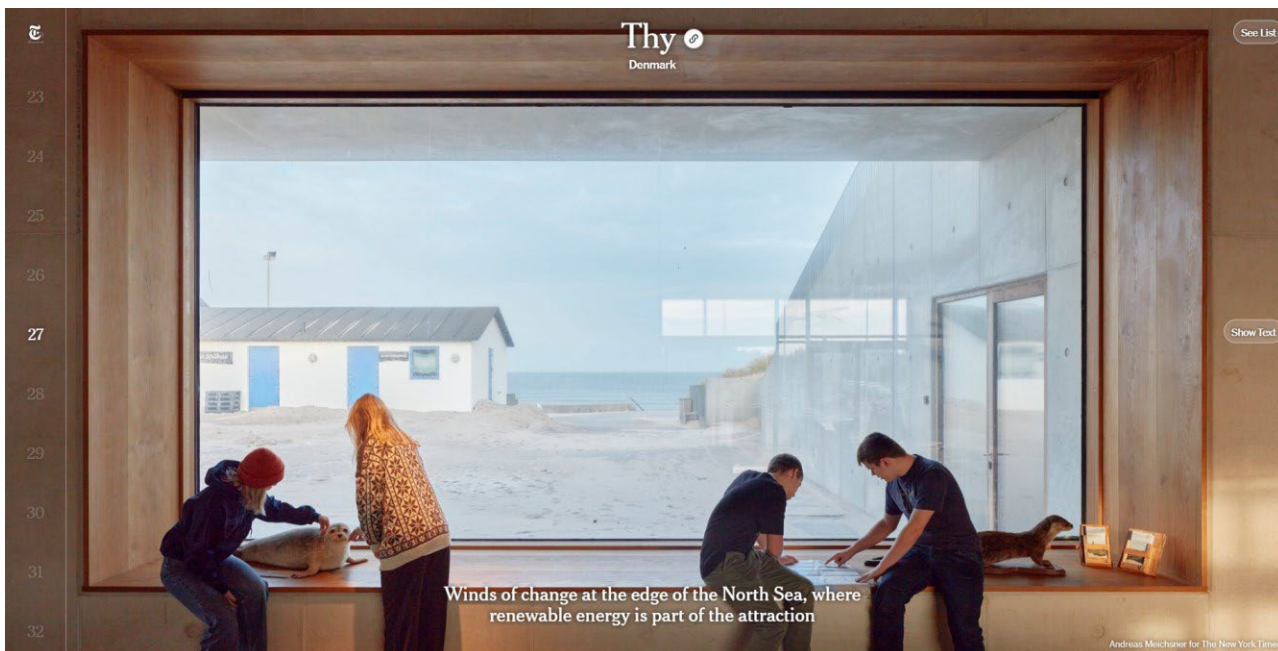
Det store vindue ud mod havet blev brugt som motiv i New York Times's omtale af Thy.

De frivillige værter melder om stor ros fra gæsterne, og selv de få skeptikere, de har mødt, er typisk gået fra stedet med større forståelse og mere positivt stemt. På Google har nationalparkcentret fået 4,7 stjerner af 5 mulige fra besøgende, der har villet dele deres oplevelser med andre. I februar 2022 blev et foto fra Nationalparkcenter Thy anvendt i New York Times i forbindelse med anbefaling af Thy som et af 52 rejsemål i 2022, hvor man som rejsende kan blive en del af fremtidens løsninger. I marts blev centeret og dets arkitekter portrætteret i en 4 sider lang artikel bragt i 20 dagblade under Jysk Fynske Medier. Og i juli blev centeret positivt anmeldt af Berlingske Tidendes arkitekturanmelder..